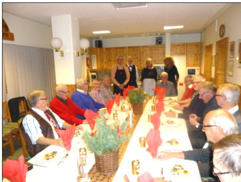
Vackert dukat festbord - härlig 3-rättersmeny - vilken succékväll det blev